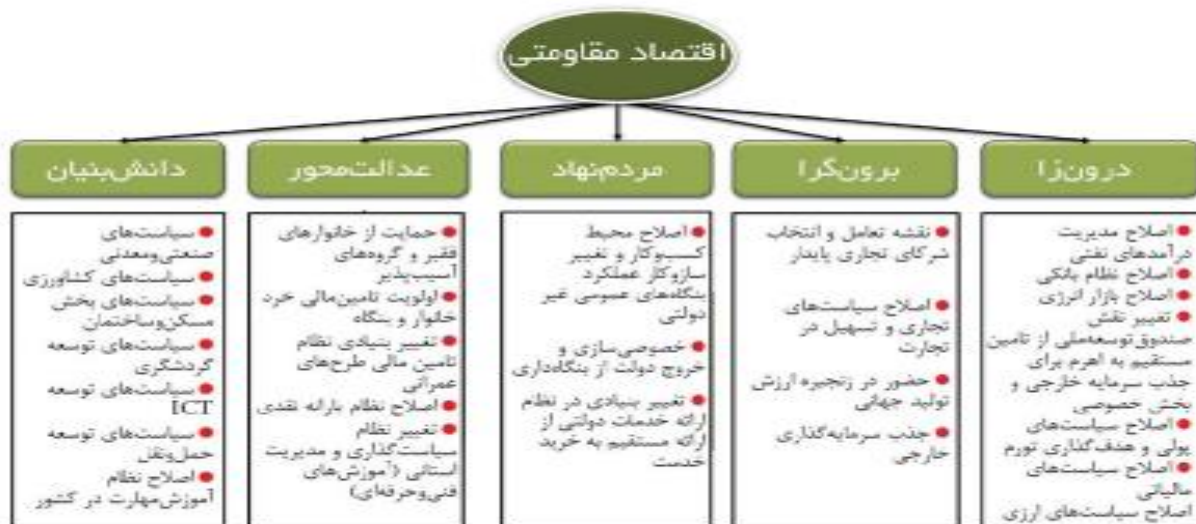
اقرار سیاست‌های پیشنهاد شده در طرح جامع مطالعات اقتصاد ایران با رویکردهای کلیدی در سند اقتصاد مقاومتی